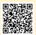
「ラーケーションの日」活動例